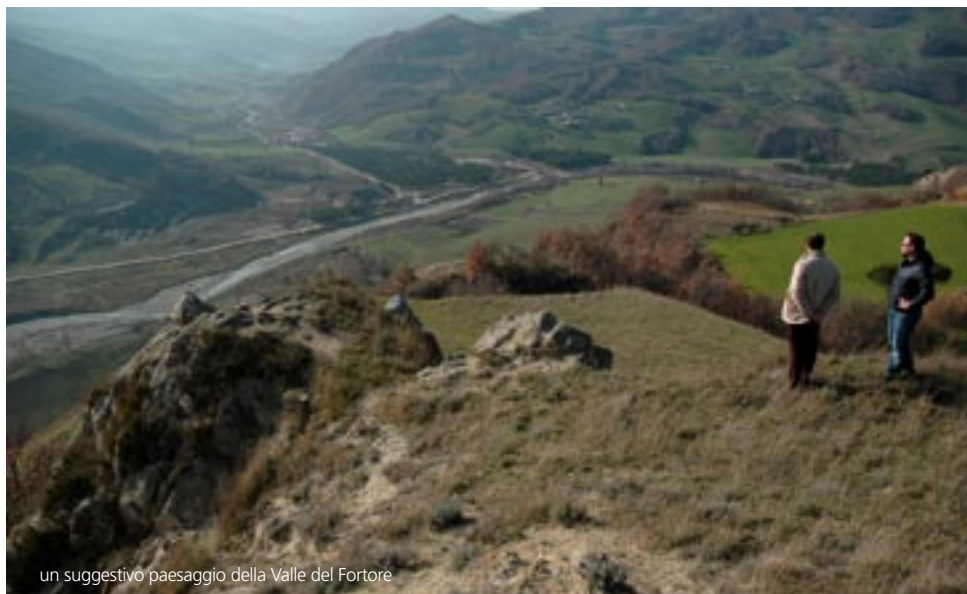
un suggestivo paesaggio della Valle del Fortore